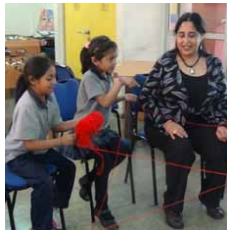
PIDEE: Talleres interculturales

La interculturalidad, hoy aceptada, como una aspiración a construir, es una reflexión que emana desde los movimientos indígenas de América Latina que, luego de un proceso de resistencia de parte de los estados nacionales, han terminado por