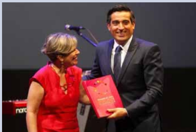
El informe entregado por el Instituto Nacional de Derechos Humanos, advirtió hoy sobre la persistencia de torturas y la necesidad de reconocer los derechos de los pueblos originarios.

La Directora del INDH hizo entrega del Informe al Vicepresidente de la República, Rodrigo Peñailillo; al Vicepresidente del Senado, Eugenio Tuma y al Presidente de la Corte Suprema, Sergio Muñoz. 🇨🇱